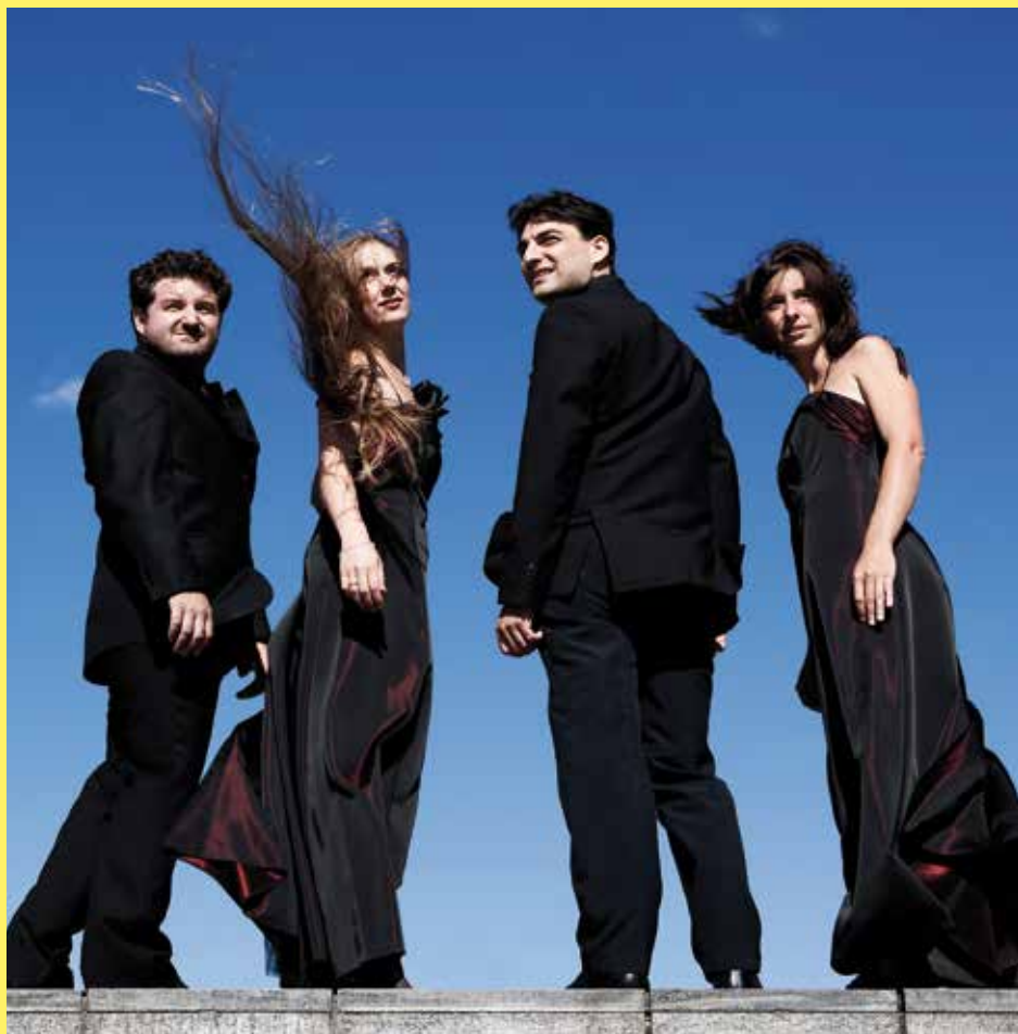
Quatuor Byron