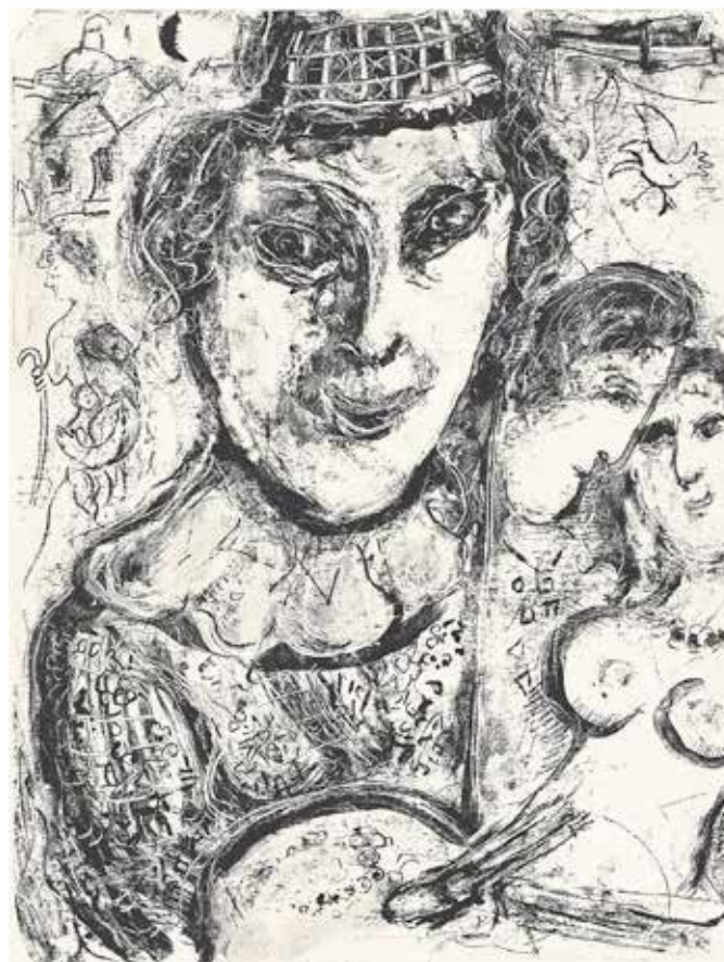
Marc Chagall, Autoportrait au couple, 1964 © Collection Charles Sorlier. Courtesy Bouquinerie de l'Institut, Paris © ADAGP, Paris 2014 - Chagall © M. 422.

Palais Lumière, 14h-16h. Atelier précédé d'une courte visite de l'exposition (30 min). Sur inscription à l'accueil : 5 € la séance (8 € les 2 séances).