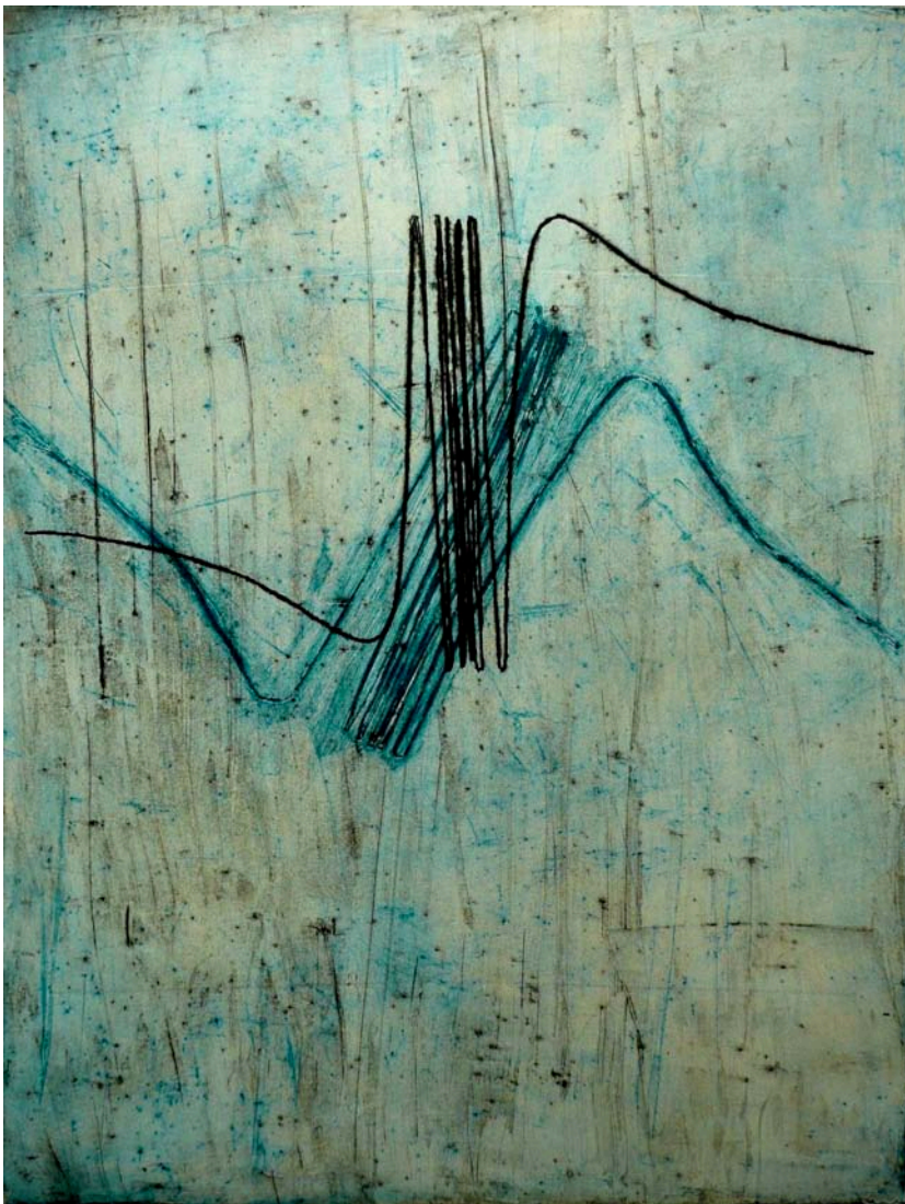
Marisa Gougeuil – Courbe mathématique – estampe