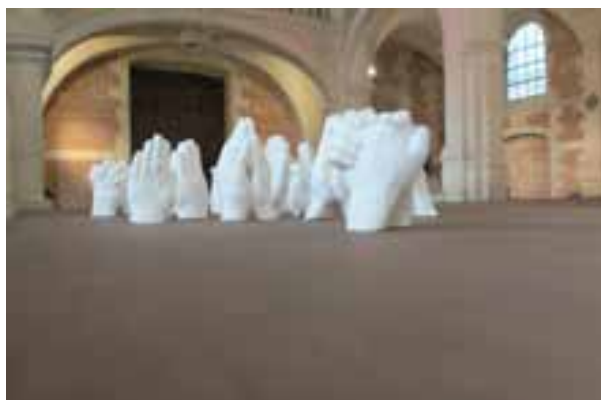
Frédérique Lucien, Precaria , 2015, vue de l'installation dans la chapelle du collège des Jésuites à Eu © Frédérique Lucien