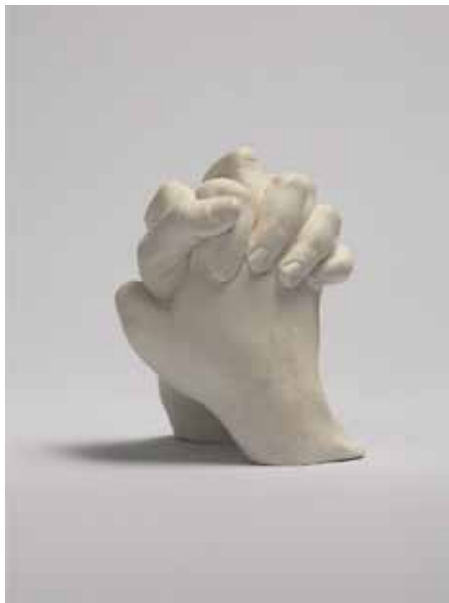
Frédérique Lucien, Précaria , 2015 Plâtre composite, 15 x 13 x 10 cm © Frédérique Lucien