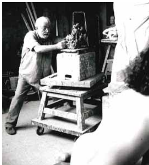
Archives Gadenne Cocteau

Charles Gadenne (1925 – 2012) est une figure incontournable du paysage artistique du Nord-Pas de Calais. Auteur de près de 400 sculptures et d'innombrables dessins réalisés durant toute sa carrière commencée en 1950, Charles Gadenne reste pour ceux qui l'ont connu, l'homme de l'amitié, de la fidélité et un homme de culture entouré de livres, de musique et des oeuvres de ses amis artistes. Son atelier-fonderie était devenu un lieu de ralliement, un lieu de découverte, un catalyseur d'idées et une source vitale, notamment lors des coulées légendaires au cours desquelles de nombreuses personnes ont pu saisir la réalité d'un créateur pris entre le métal en fusion et les moules formés de ses mains.