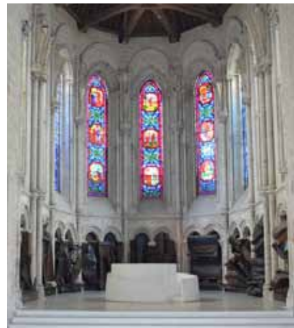
Choeur de lumière, Bourbourg