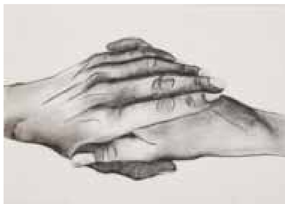
Frédérique Lucien, Main-trait , 2015 fusain sur papier, 18 x 29 cm © Frédérique Lucien

Dans le cadre de la manifestation "Cher modèle" proposée par le Musée du dessin et de l'estampe originale de Gravelines, le CIAC (Centre Interprétation Art et Culture) a invité l'artiste Frédérique Lucien à investir ses salles d'expositions mais également l'église Saint Jean-Baptiste à Bourbourg du 17 octobre 2015 au 6 mars 2016.