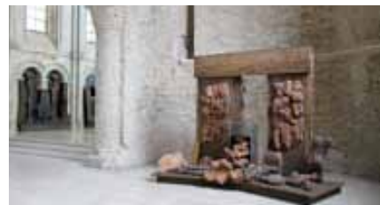
Choeur de lumière, Bourbourg