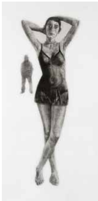
Agathe May, Joséphine - Les cracheurs I , 2007 Xylographie en noir et blanc, 175 x 61 cm Collection particulière

Les oeuvres ci-dessous ne sont pas libres de droits. A charge pour le diffuseur de s'en acquitter auprès de l'Adagp ou de la Succession Picasso.