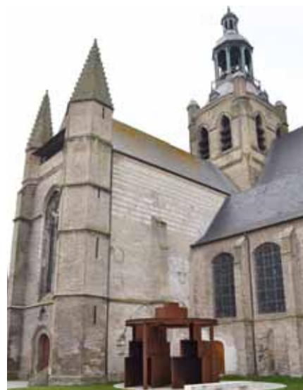
Choeur de lumière (Seuil), Bourbourg