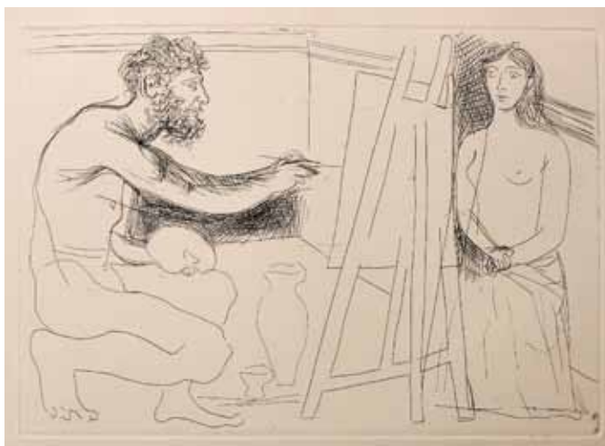
Planche extraite du Chef d'oeuvre inconnu 1927, Pablo Picasso

Qui est cet autre sous le regard de l'artiste ? La nature de leur relation influence-t-elle le sens de l'oeuvre ?