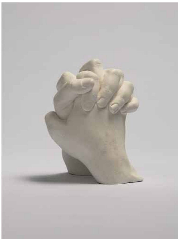
Frédérique Lucien, Précarita , 2015, Plâtre composite, 15 x 13 x 10 cm