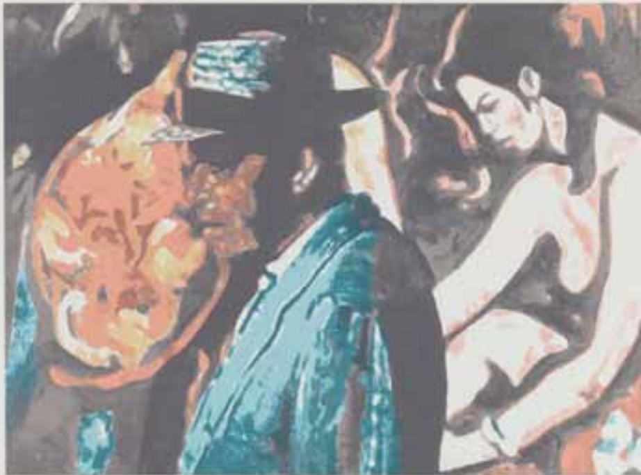
Allo! , sérigraphie, 2012

Cette série a été acquise par la Ville de La Louvière.