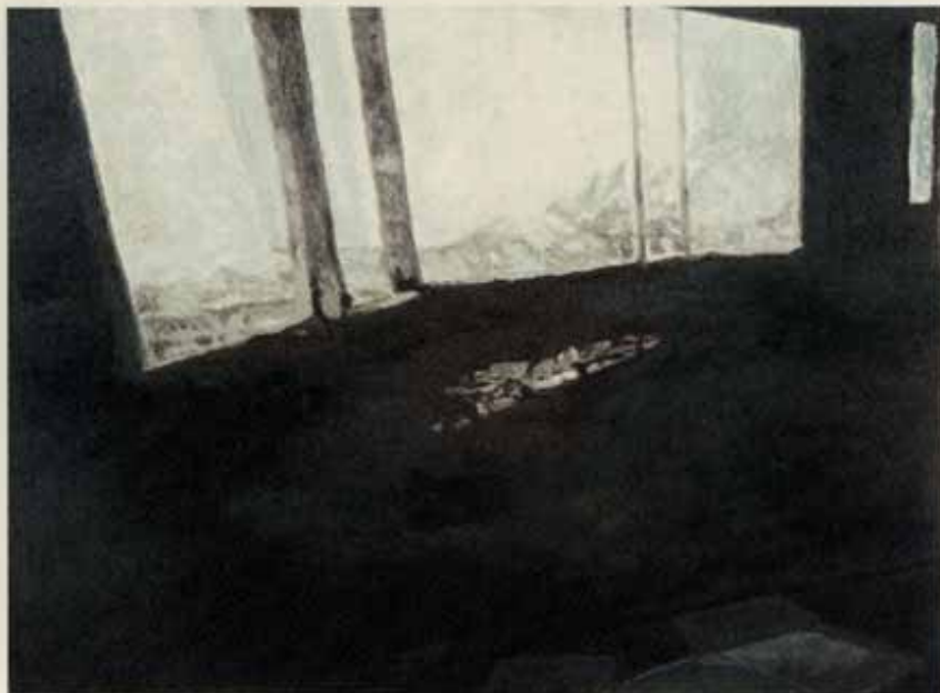
Fenêtre, sérigraphie, 2012