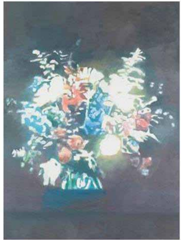
Peaches and Technicolor , sérigraphie, 2013

Luc Tuymans , l'un des artistes actuels les plus influents, est surtout connu pour sa peinture. Ses toiles figuratives, images fantomatiques aux tons pastel, abordent des sujets tels que la Seconde Guerre mondiale, le passé colonial belge ou la télé réalité. Depuis les années 1990, les œuvres sur papier deviennent une composante intrinsèque de son travail. Il y expérimente autant les techniques que les supports (papier peint, pvc, ...).