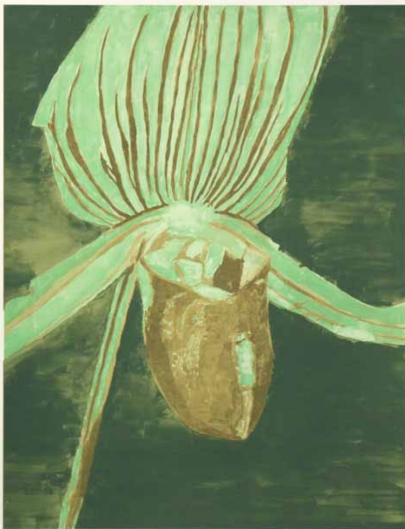
Orchid, sérigraphie, 2013

Du 7 février au 10 mai 2015, le Centre de la Gravure présente une exposition consacrée à l'œuvre imprimé de LUC TUYMANS.