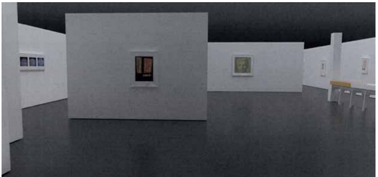
Salle d'exposition - 1 e étage