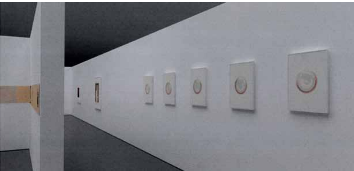
Salle d'exposition - rez

Vues virtuelles de l'exposition en préparation - 2014 :