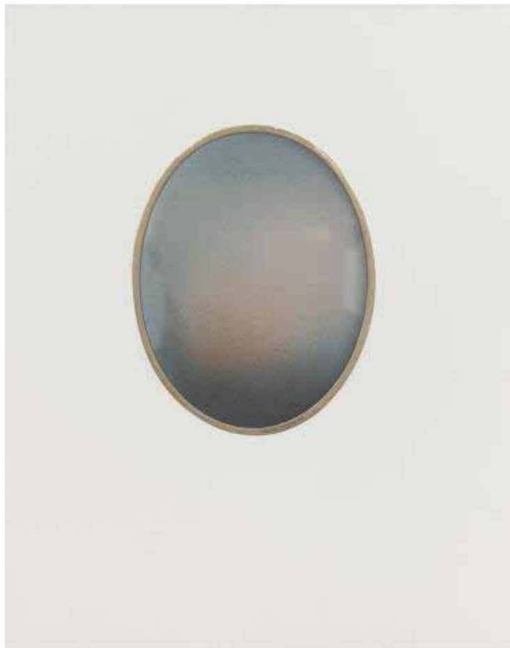
XPhone , techniques mixtes, 2011

Luc Tuymans est né en 1958 à Anvers où il vit et travaille actuellement. Il étudie la peinture à Bruxelles, y expérimente déjà la gravure mais se passionne pour l'immédiateté des techniques photographiques et du cinéma. Entre 1980 et 1985, l'artiste est plongé dans l'écriture scénaristique et tourne des courts métrages. Son amour pour la peinture refait surface après 1985. Dès lors, Luc Tuymans ne cessera plus de peindre, se basant sur un répertoire personnel d'images sources provenant de divers médias.