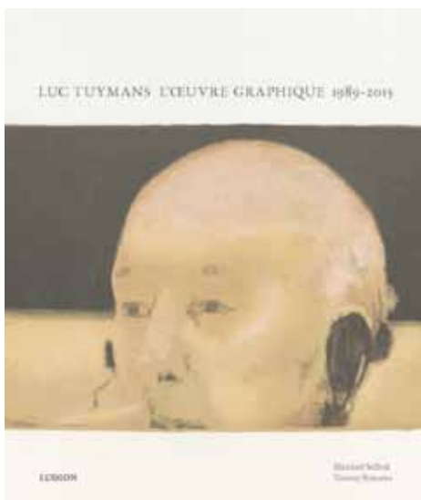
couverture du catalogue : Giscard, lithographie, 2004

En 2016, l'exposition sera présentée dans une nouvelle version au LaM de Villeneuve-d'Ascq.