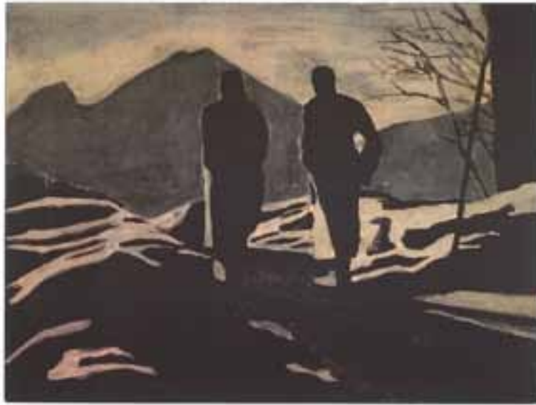
De transformatie van de berg, impression numérique, 1990