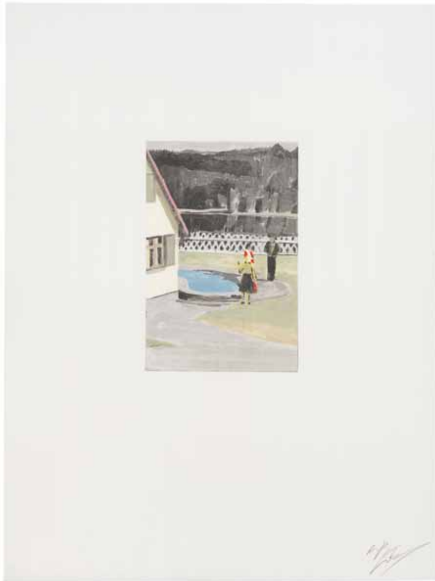
Suspended, sérigraphie, 2007

L'œuvre éponyme du titre de l'exposition, Suspended , que l'artiste conçoit en peinture et réinterprète en sérigraphie, est révélatrice de cette double démarche: elle nous montre 3 personnages dialoguant près d'une piscine dans un environnement bucolique. Il s'agit néanmoins d'objets miniatures, accessoires de trains électriques produits et commercialisés par une marque allemande alors que l'Allemagne traversait une des périodes les plus sombres de son histoire.