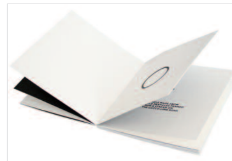
South America, Richard Long, Zédélé éditions