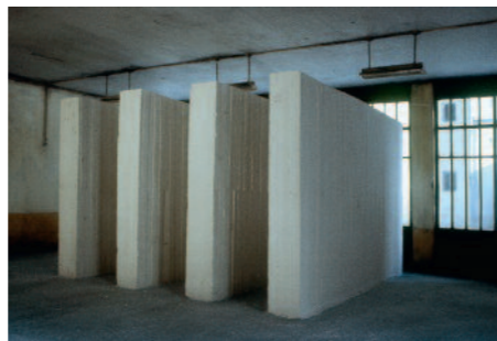
Archives 5, Hubert Renard

Diaporama rétrospectif , 2015 film muet, 7' en boucle Le travail d'Hubert Renard est présenté avec comme unique commentaire le titre, le lieu, la ville et l'année des expositions. Une rétrospective en images qui répond à celle des cartons d'invitation.