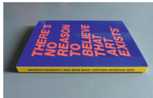
Bag Book Back, Maurizio Nannucci, Éditions Incertain Sens

Leszek Brogowski présentera divers aspects des travaux sur le livre d'artiste engagés depuis quinze ans à l'université Rennes 2 : programme de publications (Éditions Incertain Sens), recherche universitaire (collection « Grise »), pédagogie, bibliothèque (Cabinet du livre d'artiste), archives et base des données, expositions monographiques et thématiques.