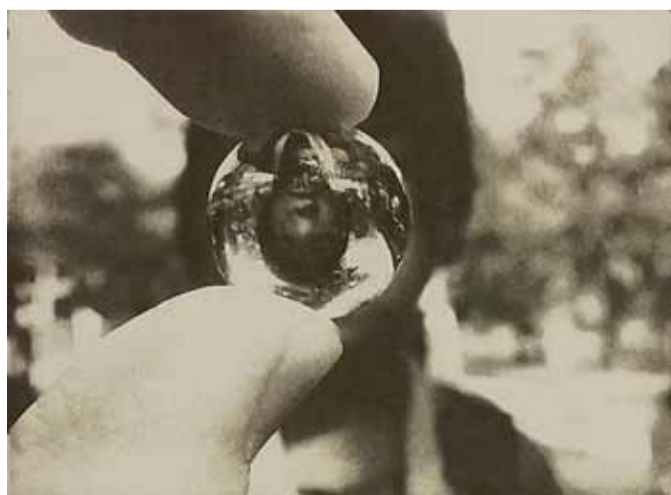
Eijiro Ito Regard, 2016, photopolymer, 17 x 23 cm