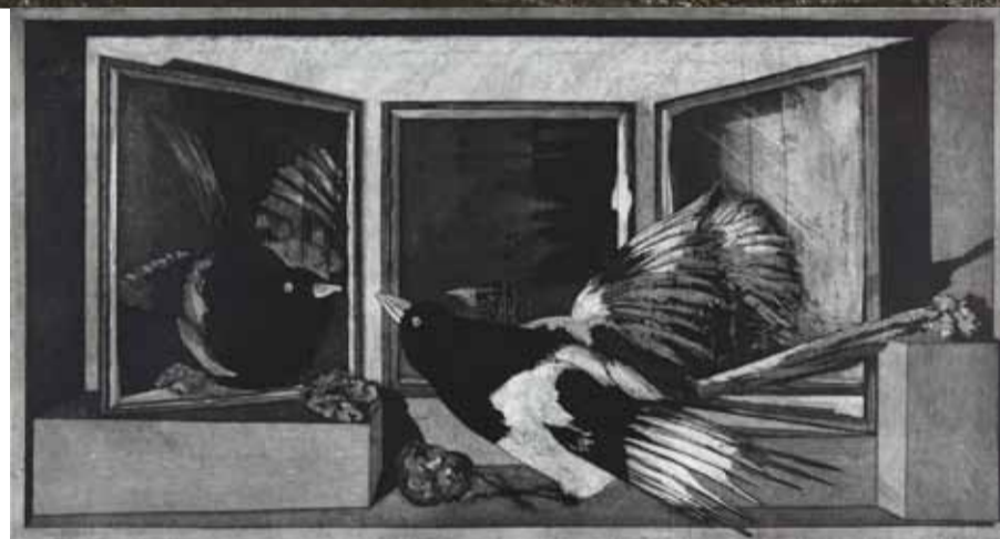
Sylvie Abélanet Vallée de la stupefaction, 2016, vernis mou et eau-forte, 64 x 92 cm

Vendredi 27, samedi 28 et dimanche 29 mai l'atelier sera ouvert de 10h à 20h. Du 30 mai au 13 juin visites sur RDV.