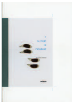
S. Hetzel, 7 saisons en Camargue , Analogues, 2016