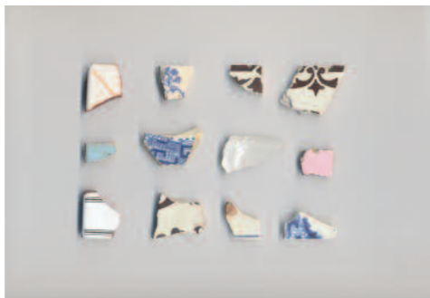
Suzanne Hetzel, Tessons , 2016

Publications d'Artistes organise une rencontre forte, chaque lieu d'exposition étant un salon où l'on s'attarde, où l'on bavarde, se pose et se repose, où l'on échange autour des œuvres.