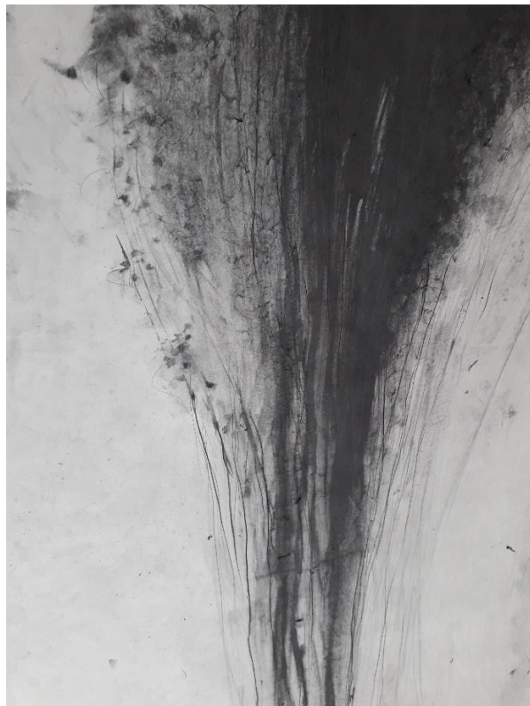
Détail d'un dessin sur papier japon, 490 x 97 cm