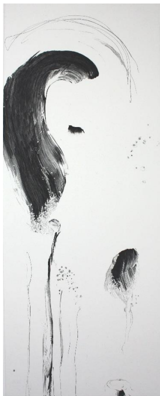
L'esprit du lieu (1) burin, 107 x 58 cm

Église Saint-Martin, Impasse de l'église, 28500 Garnay, à 5 km au sud de Dreux dans le cadre de L'Art pèlerin, du 14 au 22 septembre 2019