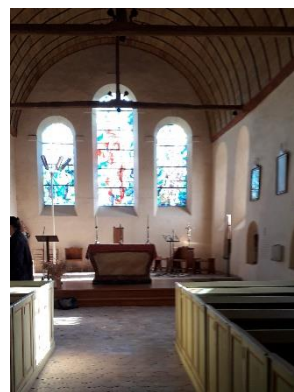
Eglise Saint-Martin XIII e - XVI e siècle