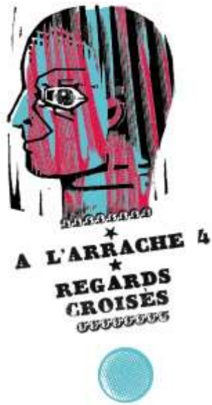
Affiche © Marc Brunier-Mestas - 2015