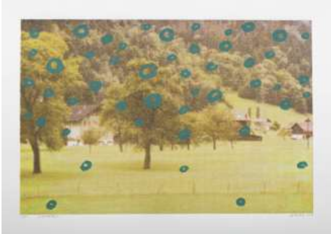
Song Neng Xuan, Chine Wuhan