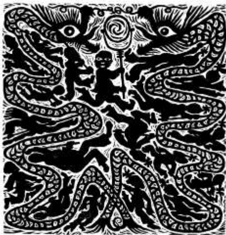
Anonyme paysan, Chine