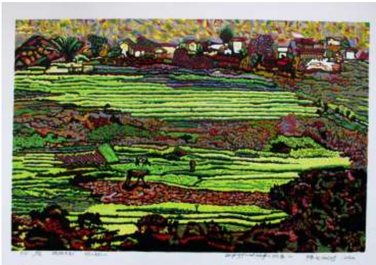
Chen Long, Chine Yunnan