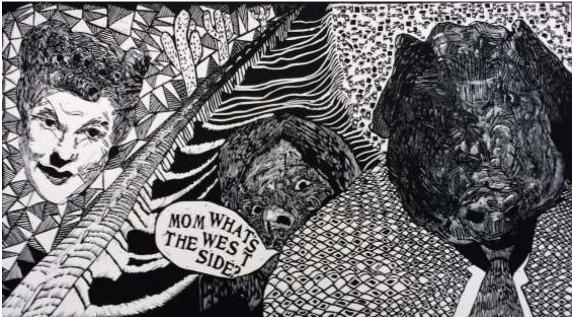
Jack Arthur Wood http://www.ucjournalism.org/archives/3024 Texas